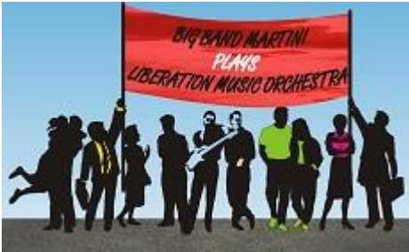
18.01.2019 Big Band Martini plays Liberation Music Orchestra